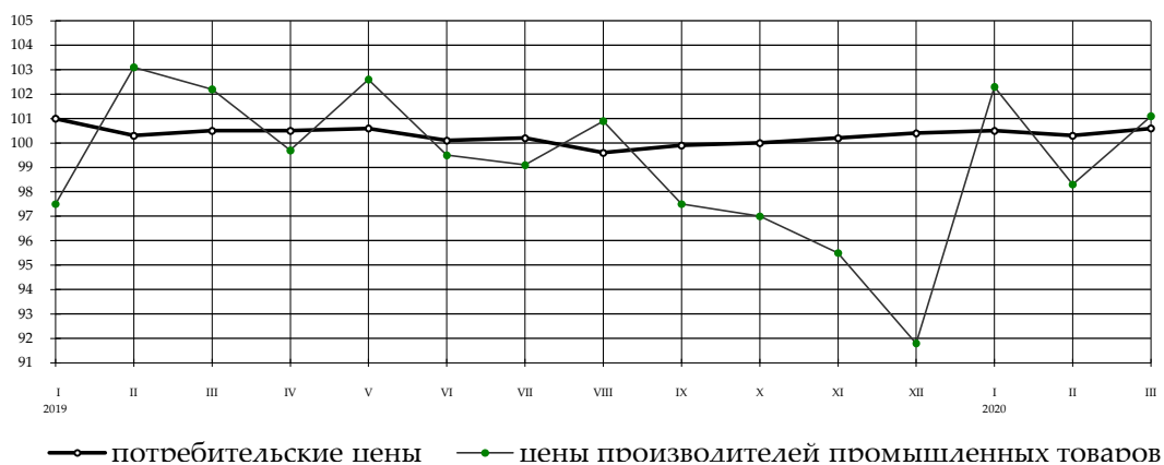
Индексы потребительских цен и цен производителей промышленных товаров на конец месяца, в % к предыдущему месяцу