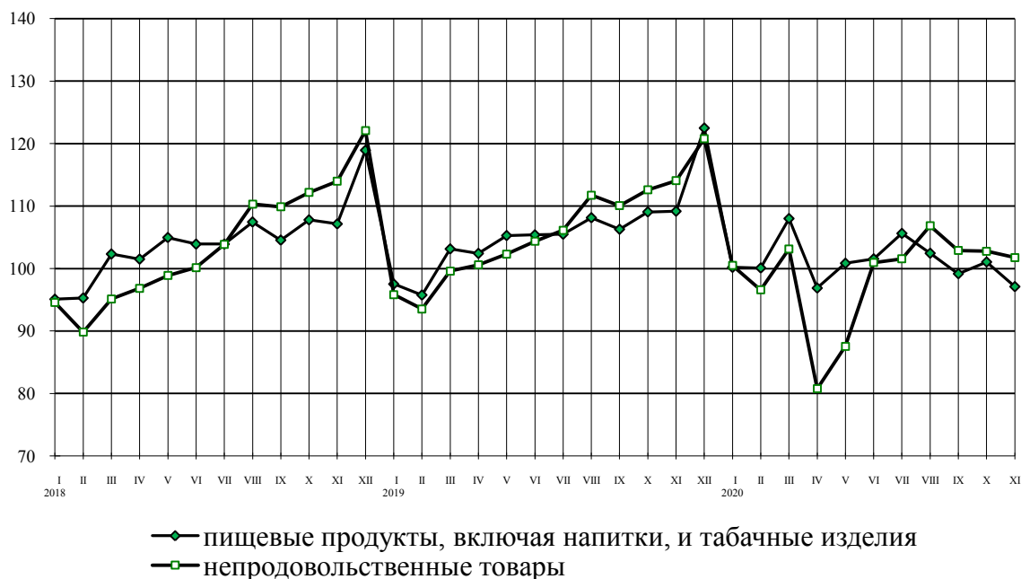
Динамика оборота розничной торговли пищевыми продуктами, включая напитки, и табачными изделиями, непродовольственными товарами в % к среднемесячному значению 2017 г.