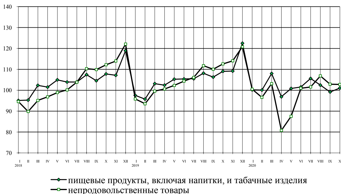
Динамика оборота розничной торговли пищевыми продуктами, включая напитки, и табачными изделиями, непродовольственными товарами в % к среднемесячному значению 2017 г.