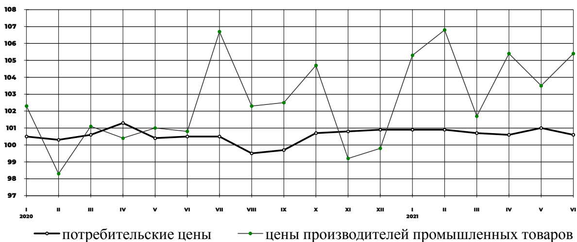
Индексы потребительских цен и цен производителей промышленных товаров на конец месяца, в % к предыдущему месяцу