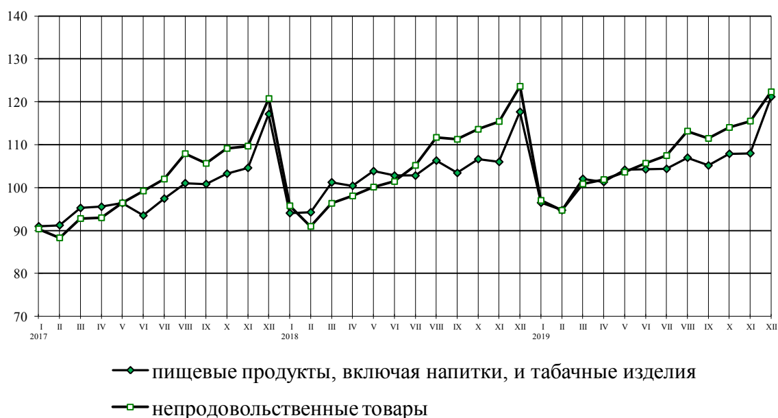
Динамика оборота розничной торговли пищевыми продуктами, включая напитки, и табачными изделиями, непродовольственными товарами в % к среднемесячному значению 2016 г.