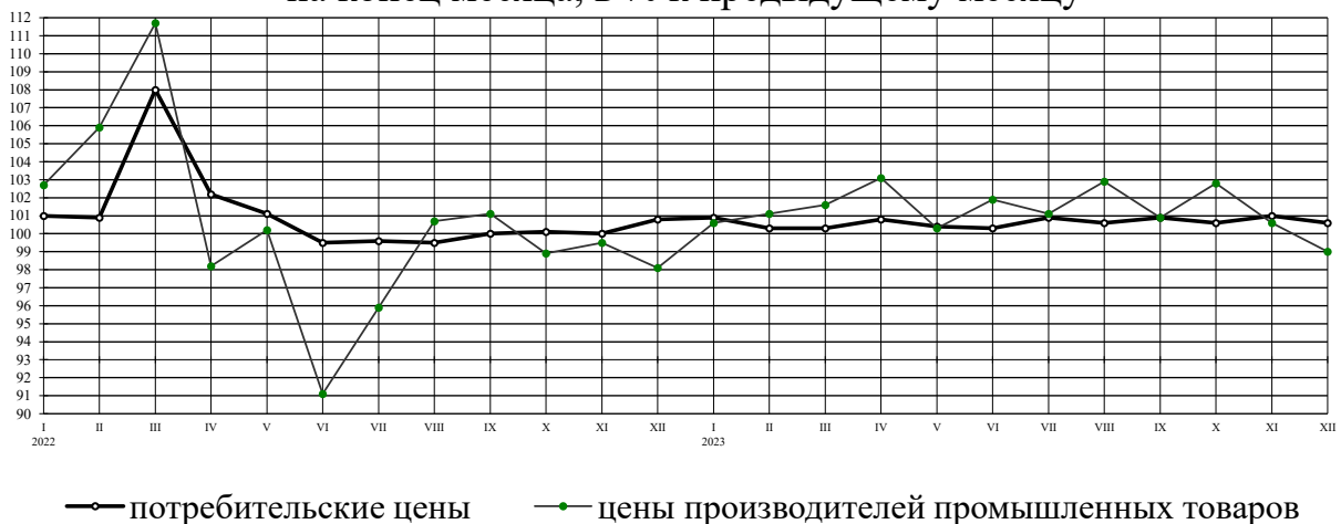
Индексы потребительских цен и цен производителей промышленных товаров на конец месяца, в % к предыдущему месяцу