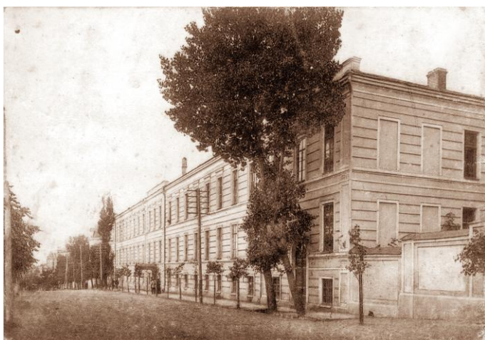
Здание присутственных мест по ул. Набережной, где размещался Курский Губернский Статистический Комитет и многие службы губернского правления: редакция «Курских губернских ведомостей», губернская типография, нотариат, канцелярия прокуратуры, окружной суд, квартира вице-губернатора и др. Ныне – один из цехов АО «Курский электроаппаратный завод» по ул. Сонины

Исторический путь нашей службы был длительным и сложным, процесс формирования органов государственной статистики в Курской области, как и в других регионах России, проходил в несколько этапов, вслед за общественно-политическими изменениями в государстве и в обществе.