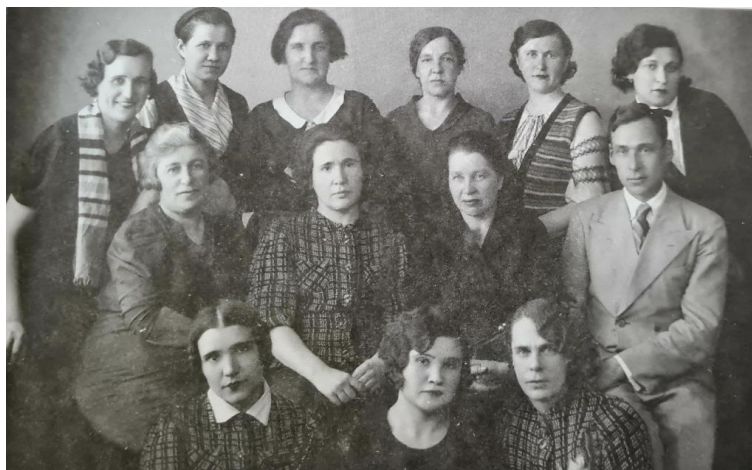
Сотрудники Курской городской инспектуры ЦСУ, май 1941 года

Впервые в статистической практике был применен метод срочных переписей (наличия грузов, материалов, топлива), которые проводились оперативно и по краткой программе. В годы войны проведено 47 переписей неустановленного оборудования, свыше 100 срочных переписей и учетов.