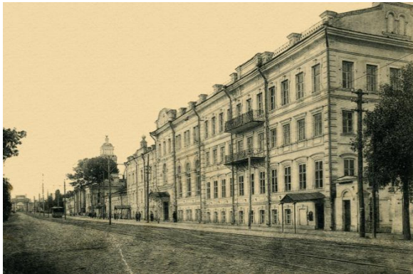
Здание Курской земской управы, в котором располагалось Губернское статистическое бюро. 1918 год

Работа Губернского Статистического Комитета по сбору и обработке данных, их накоплению и составлению динамики постепенно приобретала необходимую ценность как официальный источник информации, обеспечивающий качественное исполнение функций органов власти и управления отдельного региона и страны в целом.