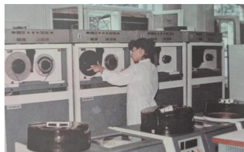
Обслуживание ЭВМ ЕС – 1035, 1987 год