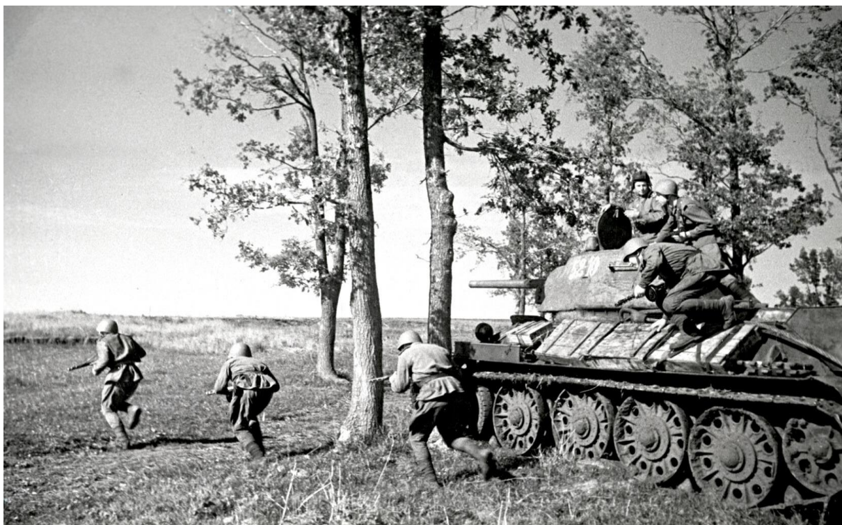
Автоматчики во время учений перед боями на Курской дуге. Май-июнь 1943 г.

После поражения под Сталинградом немецкое командование решило взять реванш, имея в виду осуществление крупного наступления на советско-германском фронте, местом которого была избрана Курская дуга. Курская битва, подобно сражениям под Москвой и Сталинградом, отличалась большим размахом и направленностью.