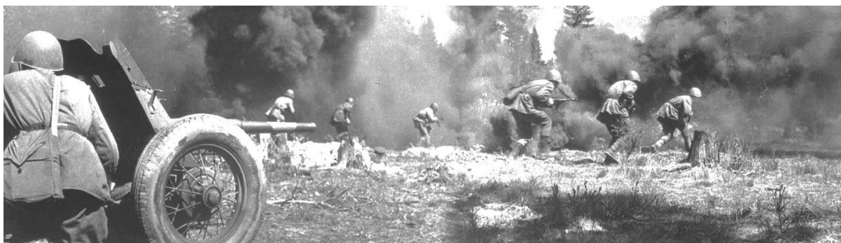
Советские зенитчики в районе боев на Курской дуге

Вначале предполагалось, что советские войска первыми перейдут в наступление, замысел которого состоял в разгроме немецких групп армий «Юг» и «Центр» и сокрушении вражеской обороны от Смоленска до Черного моря: Ставка советского Верховного Главнокомандования работала над этим планом с конца марта 1943 г. Однако благодаря разведке Красной армии стало известно о планах вермахта нанести удар летом 1943 г. под основание выступа в линии фронта, в центре которого находился город Курск. Немецкая операция получила кодовое наименование «Цитадель», дата ее начала была определена – 5 июля 1943 г. Немцы стремились оснастить войска как можно большим количеством новых танков «Тигр» и «Пантера». Эти бронированные машины превосходили по своей огневой мощи и бронестойкости основной советский танк Т-34. В оперативном приказе ставки вермахта № 6 от 15 апреля 1943 г. указывалось, что наступлению на Курской дуге (операция «Цитадель») «придается решающее значение» и что «победа под Курском должна явиться факелом для всего мира».