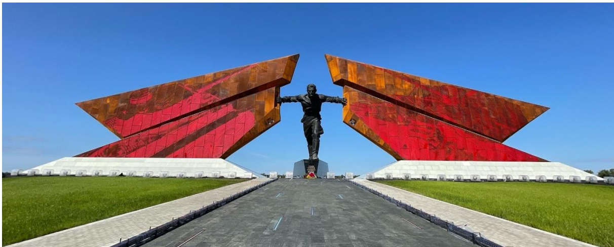
Мемориальный комплекс «Курская битва» в п. Поныри

Беспримерное в истории ожесточенное танковое сражение оставило неизгладимый след в памяти человечества. Дорогой ценой далась победа в Курской битве. На Курской земле около 400 памятников боевой славы, 330 братских могил, где покоятся воины, отдавшие жизнь за свободу нашей Родины. Именами героев названы улицы, площади, населенные пункты, школы в городах и районах области.