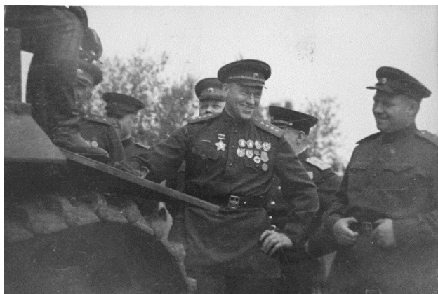
Командующий Центральным фронтом генерал армии К.К. Рокоссовский осматривает немецкий тяжелый танк «Тигр», подбитый артиллеристами 307-й дивизии под Поньями в июле 1943 г.

Ставкой Главного Командования Вооруженных сил СССР было принято решение – не переходить первыми в наступление, а занять жесткую оборону. Замысел советского командования состоял в том, чтобы вначале обескровить противника, выбить его новые танки, и лишь затем, введя свежие резервы, перейти в контрнаступление. Сталин согласился с мнением генералов, советовавших глубоко зарыться в землю, хотя полной уверенности в том, что немцы первыми нанесут удар, не было.