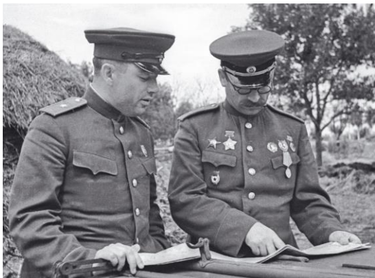
Командование 5-й гвардейской танковой армией (справа – командующий генерал-лейтенант П.А. Ротмистров) обсуждают план боевых действий

Наиболее яростным был удар Манштейна в направлении Прохоровки, где 10-15 июля произошло самое большое танковое сражение Второй мировой войны, в котором с обеих сторон участвовало до 1200 танков и самоходных орудий. Именно это сражение во многом определило весь последующий ход событий. В помощь войскам Воронежского фронта решением Ставки была передана из Степного фронта 5-я гвардейская танковая армия генерала П.А. Ротмистрова. Ему была поставлена задача нанести удар по вклинившимся танкам противника. Предстоял ближний бой, в котором преимущества немецкой брони и орудий во многом пропадали.