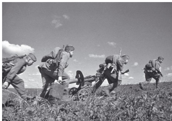
Расчет советского станкового пулемета «Максим» меняет позицию во время боев на Курской дуге

Броня немецких танков помогла им на некоторых участках пробить советскую оборону и вклиниться в боевые порядки частей Красной армии. Передовые советские подразделения, которые не могли сдержать натиск «Тигров», не складывали оружия. Они продолжали сражаться, уничтожая пехоту. Немецким танковым клиньям удалось продвинуться на северном крыле Курского выступа до 15 км, на южном – до 35 км. На северном участке немцы выдохлись у населенного пункта Поньри, где они понесли огромные потери. Лишившись с начала наступления 50 тысяч человек и 400 танков северная ударная группа противника была вынуждена остановиться.