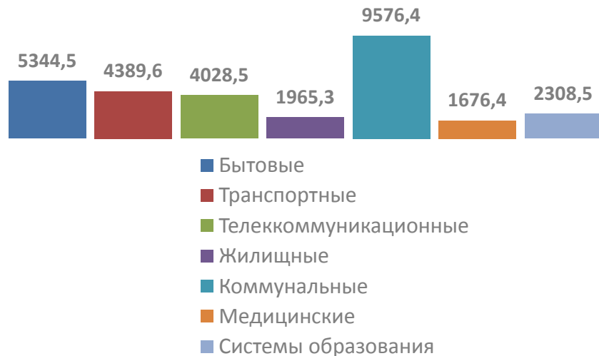
СТРУКТУРА УСЛУГ НАСЕЛЕНИЮ