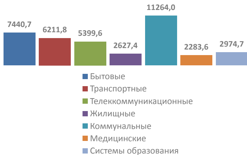
СТРУКТУРА УСЛУГ НАСЕЛЕНИЮ