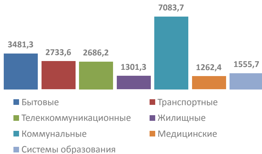
СТРУКТУРА УСЛУГ НАСЕЛЕНИЮ