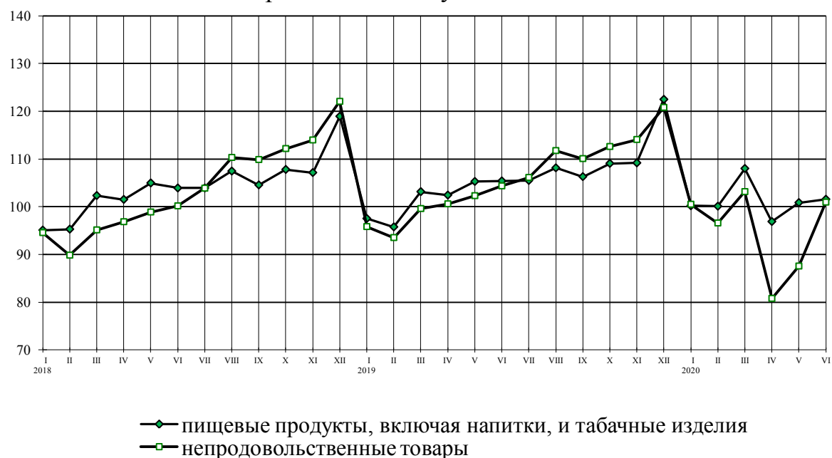
Динамика оборота розничной торговли пищевыми продуктами, включая напитки, и табачными изделиями, непродовольственными товарами в % к среднемесячному значению 2017 г.