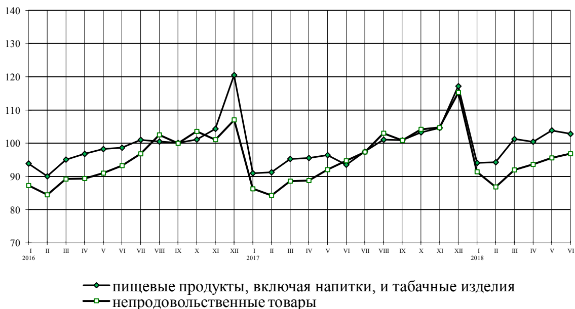
Динамика оборота розничной торговли пищевыми продуктами, включая напитки, и табачными изделиями, непродовольственными товарами в % к среднемесячному значению 2015 г.