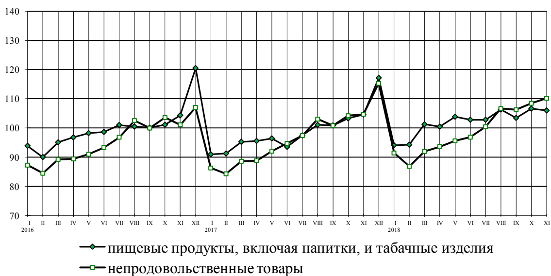
Динамика оборота розничной торговли пищевыми продуктами, включая напитки, и табачными изделиями, непродовольственными товарами в % к среднемесячному значению 2015 г.