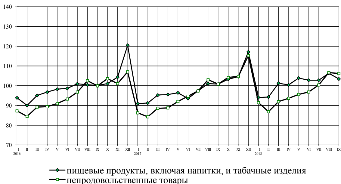
Динамика оборота розничной торговли пищевыми продуктами, включая напитки, и табачными изделиями, непродовольственными товарами в % к среднемесячному значению 2015 г.