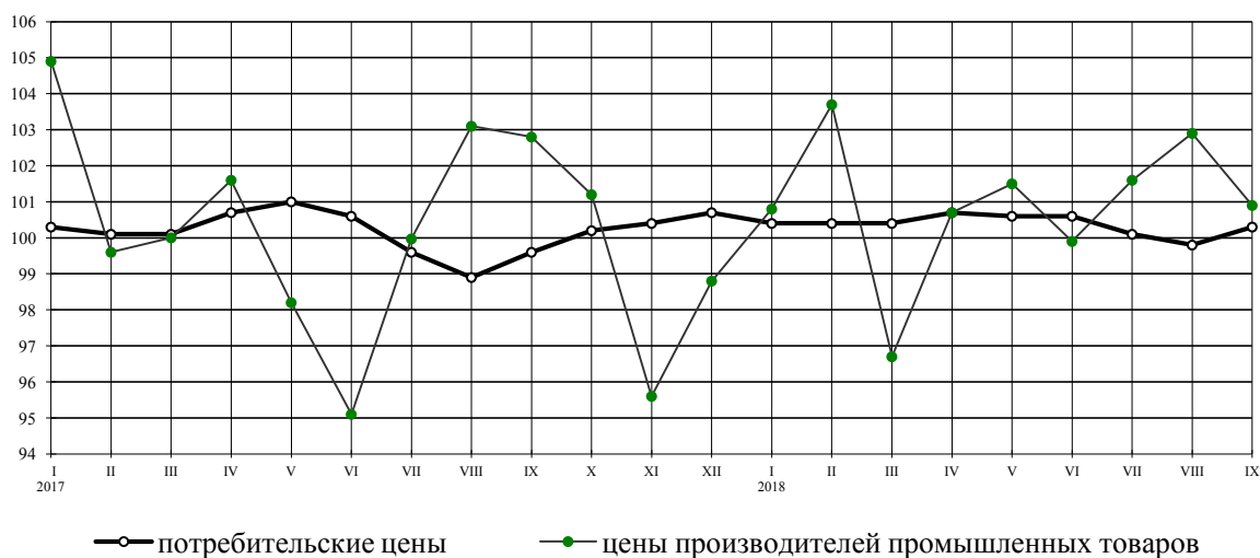
Индексы потребительских цен и цен производителей промышленных товаров на конец месяца, в % к предыдущему месяцу